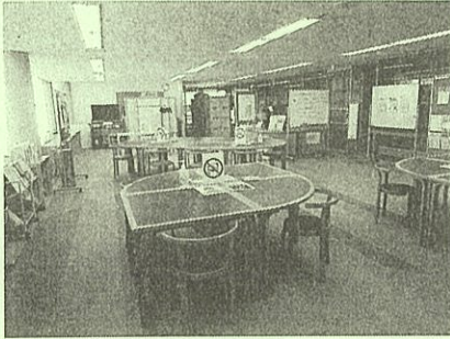
ボランティア交流サロン

この施設を皆さん方にどんどん利用していただき、さらに交流が深まり、積極的な活動が展開できますよう願っております。