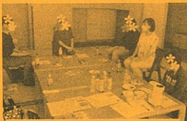
みんなでワイワイガヤガヤおしゃべり会