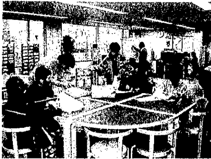
ボランティア交流サロン

この施設を皆さん方にどんどん利用していただき、さらに交流が深まり、積極的な活動が展開できますようお願いしております。